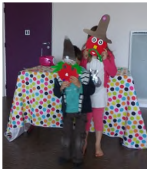
Création d'un conte puis présentation « théâtrale »