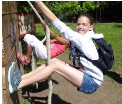
Journée au Château de Enigmes (Pons)