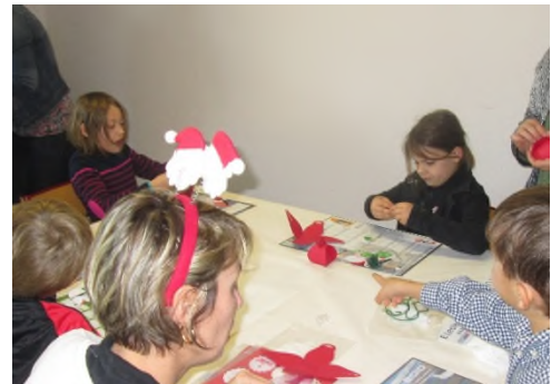
Atelier créatif Noël