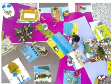
Initiation au « Land Art »